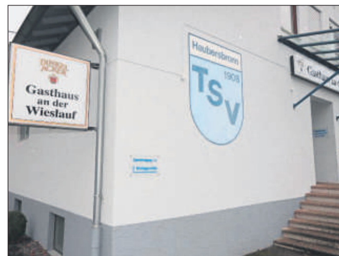
Die Vereinsgaststätte des TSV Haubersbronn.