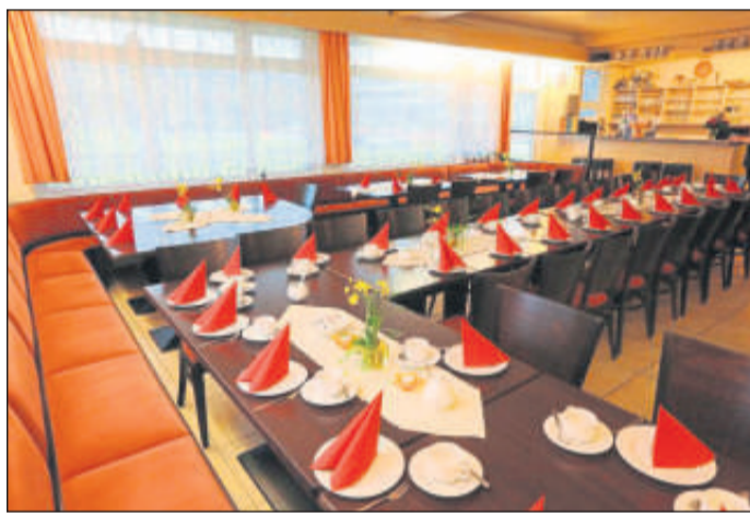
Bitte Platz zu nehmen - es wird gleich angerichtet.

Vereinsgaststätte „An der Wieslauf“ Lauswiesen 2 73614 Schorndorf-Haubersbronn Tel: 07181 486785 Fax: 07181 990639 E-mail: ghwieslauf@yahoo.de